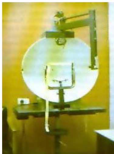
Figura 3. Perímetro de Goldman

El notorio avance en imágenes en los últimos cuarenta años, también ha revolucionado el diagnóstico y manejo de la patología orbitaria y neurooftalmológica. El ultrasonido, la tomografía computarizada y las imágenes de resonancia magnética se encuentran aún en constante desarrollo.