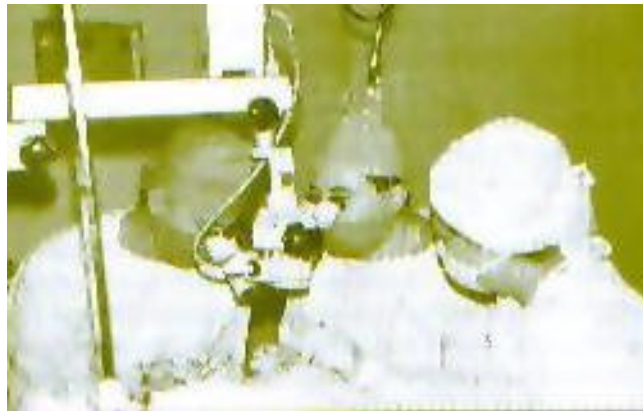
Figura 2. Microscopio quirúrgico

La mayor contribución al desarrollo de la moderna microcirugía y desde luego a la microcirugía ocular, fue hecha con el microscopio quirúrgico, desarrollado por Carl Zeiss en colaboración con el profesor Dr. Horst Wullstein y el profesor Dr. Heinrich Harms (oftalmólogo) en el año 1953. El OPMI I dio paso al OPMI 3 y OPMI 4, microscopios éstos diseñados para cirugía ocular con la asesoría del profesor Barraquer (figura 2).